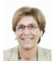
Marie-Noëlle Lienemann Sénatrice de Paris mn.lienemann@senat.fr