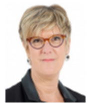
Céline Brulin Sénatrice de Seine-Maritime c.brulin@senat.fr