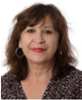
Éliane Assassi Sénatrice de Seine-Saint-Denis - Présidente du groupe CRCE e.assassi@senat.fr