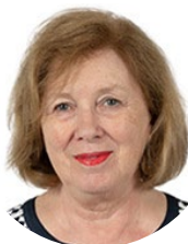
Catherine Deroche Sénatrice (LR) de Maine-et-Loire Présidente

Réunie le mercredi 29 mars 2023 sous la présidence de Catherine Deroche, la commission n'a pas adopté la proposition de loi , considérant qu'elle n'apporte pas de garanties supplémentaires aux travailleurs et qu'il est prématuré de légiférer alors que des travaux sont en cours au niveau européen. La discussion en séance publique portera sur le texte déposé.