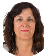
Cathy Apourceau-Poly Sénatrice (CRCE) du Pas-de-Calais Rapporteuse

Consulter le dossier législatif : http://www.senat.fr/dossier-legislatif/ppl21-770.html